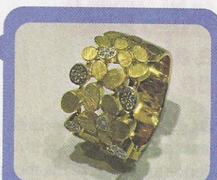
Anel com diamantes. Linha Be Luisa. €3.050

sign inteiramente português, as marcas mais importantes também podem ser compradas nesta loja. A lista é grande: Audemars Piguet, Breitling, Bulgari, Cartier, Chanel, Chaumet, Chopard, Chronoswiss, Dior, Graham, Hermes, H. Stern, Hublot, Jaeger LeCoultre, Marco Bicego, Omega, Oris, Patek Philippe, Porsche Design, Rolex, Tag Heuer, Vacheron Constantin ou Zenith.