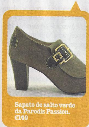
Sapato de salto verde da Parodis Passion. €149

Com uma decoração minimalista e atractiva, o espaço (de 40 metros quadrados) parece bem maior do que na realidade é. O branco enche todas as paredes, bem como as prateleiras onde estão colocados os modelos mais vistosos das marcas. O balcão (à esquerda da porta) é discreto e não perturba o olhar. Aqui encontra sapatos, sandálias e botas de homem e mulher.